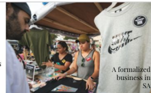
A formalized business in SA