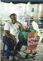
An informal business in SA

Formalization is a worthwhile process that can help you increase profits and plan your future