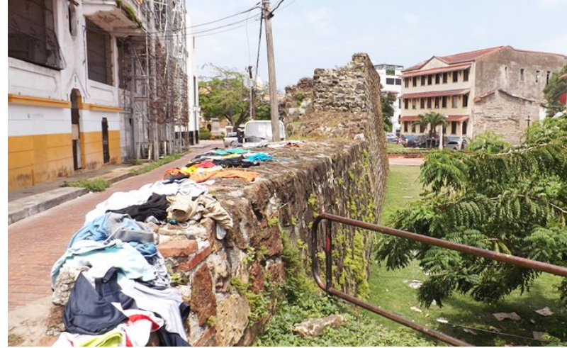
Wall remnants in Casco Viejo