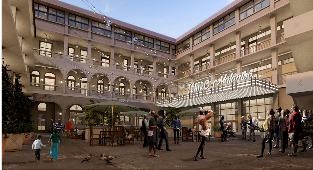
La Manzana, Santa Ana