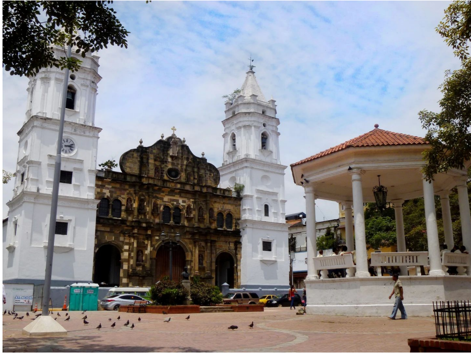
Metropolitan Cathedral, Casco Viejo