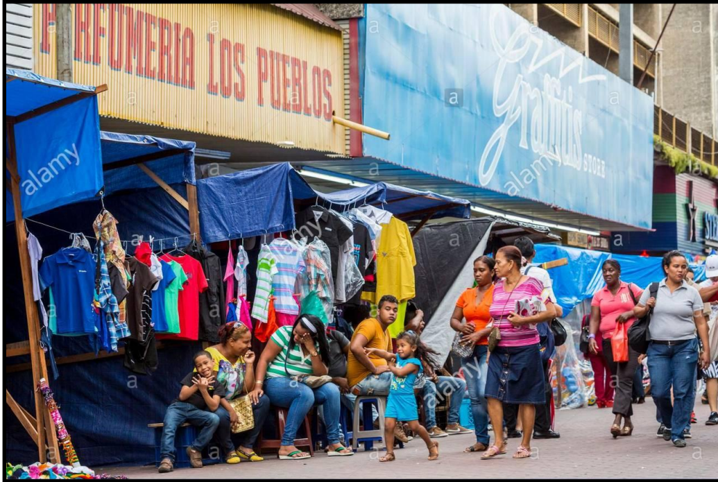
Street Vendors in Santa Ana