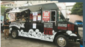
A formalized business in SA