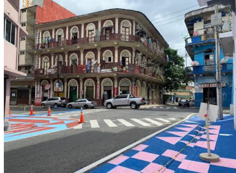
La Parada Sana, Santa Ana